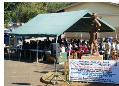
Zambia, Museo de Livingstone