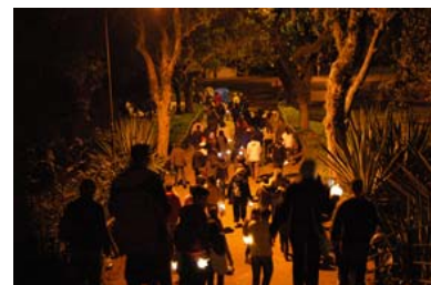
Brasil, Museo de arte moderno de São Paulo

Por segundo año consecutivo el ICOM patrocinó la Noche Europea de los Museos el 19 de mayo pasado, lo que supuso un completo fin de semana dedicado a actividades museísticas.